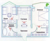
План квартиры после реконструкции с расстановкой мебели

мебели и оборудования $20 000–35 000 материалов $10 000–20 000