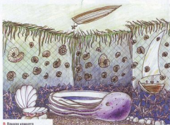
В. Ванная комната

Ванная комната представляет собой декорацию морского дна. Пол покрыт шлифованной галькой. Цвет плитки на стенах изменяется от насыщенного синего внизу до светло-бирюзового вверху, создавая иллюзию морской глубины. Глиняный натяжной потолок нежного салатного оттенка ассоциируется с поверхностью воды, освещенной солнцем. Декора-