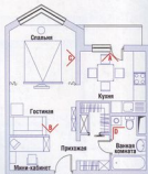
План квартиры после реконструкции с расстановкой мебели