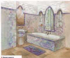
D. Ванная комната

Стены ванной комнаты отделаны керамической плиткой бирюзовых и сиреневых тонов. За ванной — фальшстена из влагостойкого гипсовартона, в которой устроены три стрельчатые ниши. Центральная ниша с решетчатыми ставками имитирует окно; в боковых сделаны стеклянные полки для банных принадлежностей. ●