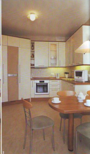
Индивидуальный проект (трехкомнатная квартира)