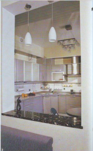
Индивидуальный проект (трехкомнатная квартира)